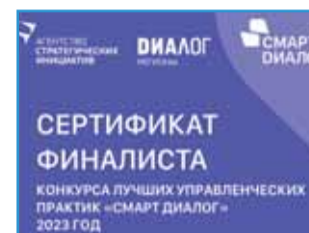
В финале конкурса лучших управленческих практик