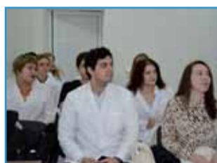
ОКФЦ принял новых ординаторов