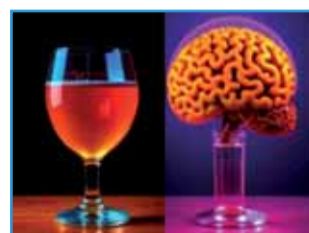
Алкоголь и здоровье не совместимы!